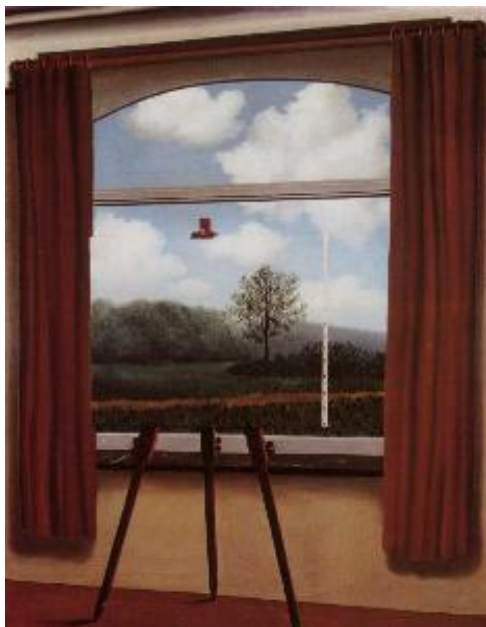
La condición humana

René MAGRITTE: La condición humana, La llave de los campos, El catalejo. “Los que escucharon mi intervención en las Jornadas Provinciales concernientes al fantasma, {...} pueden recordar de qué me serví como metáfora: de un cuadro que viene a ubicarse en el marco de una ventana. Técnica absurda, sin duda, si se trata de ver mejor lo que hay sobre el cuadro, pero, como también lo expliqué, no es de eso, justamente, que se trata, es de, cualquiera que sea el encanto de lo que está pintado sobre la tela, no ver lo que se ve por la ventana.”